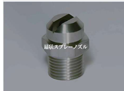
強力な洗浄および水膜形成に適した扇状スプレーノズルをご紹介します。

高い衝撃力を持ち、強力な洗浄や均一な水膜形成に適しています。高圧洗浄タイプも用意。