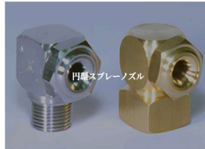
空調・塗装設備・エアシャワーに適した円環スプレーノズルをご紹介します。