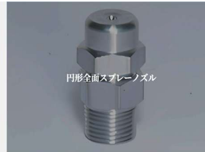
水滴が荒く、広範囲の洗浄に適した円形全面スプレーノズルをご紹介します。