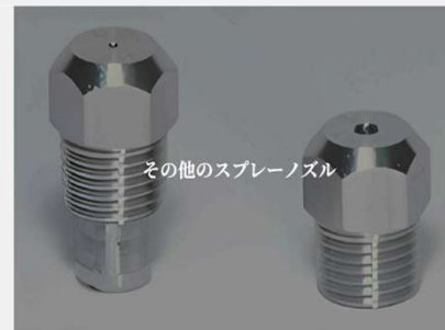
棒流・加湿・傘上タイプなど、その他のスプレーノズルをご紹介します。